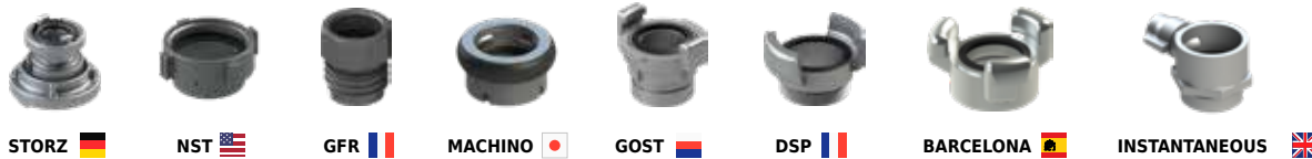
STORZ NST GFR MACHINO GOST DSP BARCELONA INSTANTANEOUS

*필요에 따라 제품에 다양한 종류의 커플링 장착 가능 *Products can be equipped with other types of couplings if needed