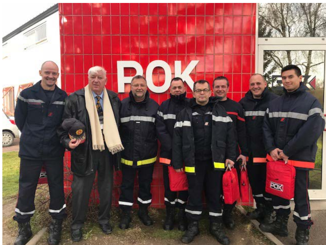
Une délégation de sapeurs-pompiers de la brigade de Nogent-sur-Seine