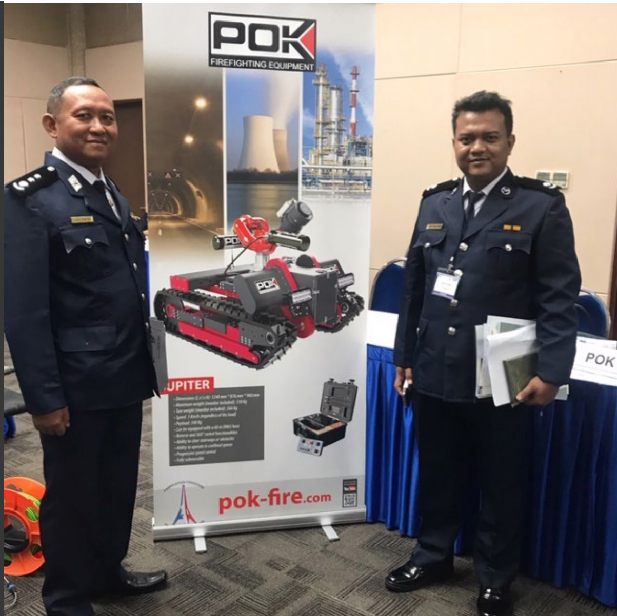
Nos visiteurs devant le stand POK