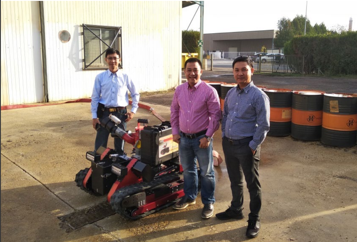
Nos partenaires Asiatiques lors de la démonstration du Jupiter ®

Vietnam. Ce fut l'occasion d'analyser les réponses techniques les plus appropriées aux besoins de nos clients vietnamiens.